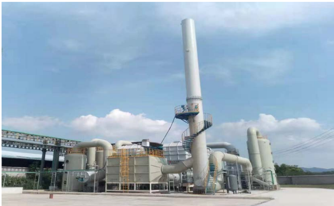
废气处理工艺流程图：车间废气通过冷凝/吸附+喷淋+RTO 焚烧